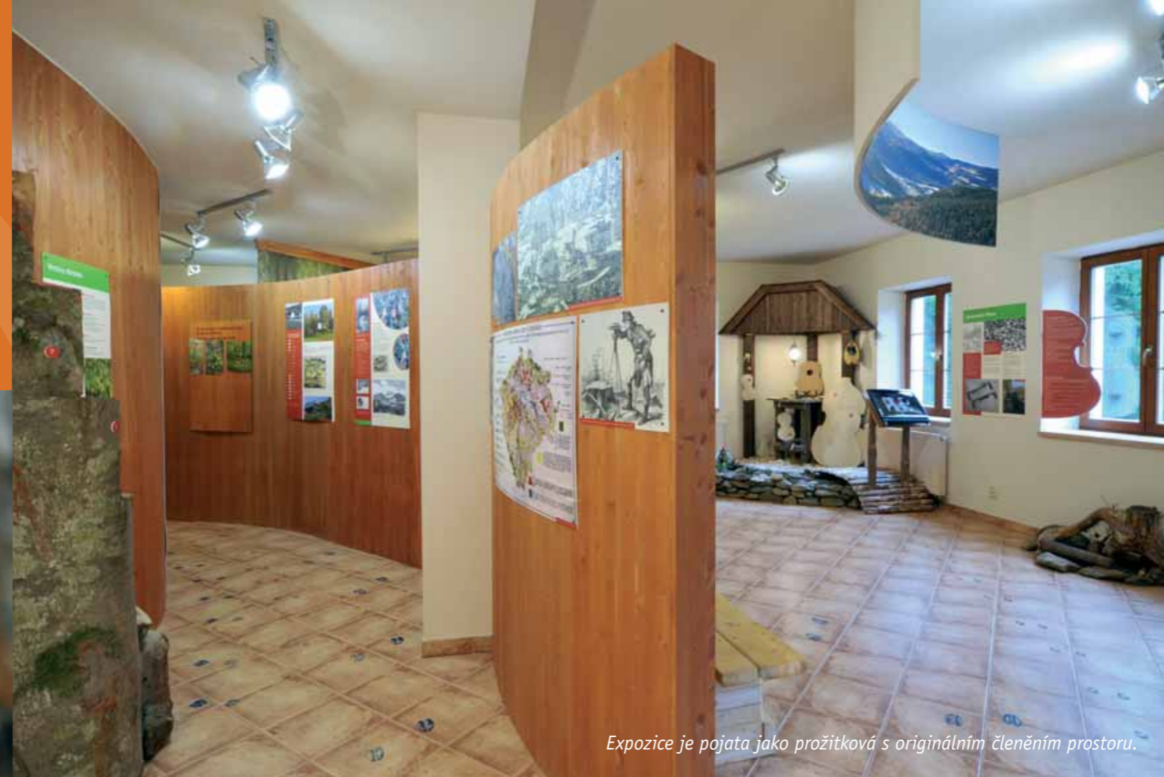
Expozice je pojata jako prožitková s originálním členěním prostoru.

Idina pila pod Boubínem – bývalá schwarzenberská hájovna začala v devadesátých letech sloužit jako jediné informační středisko na území CHKO Šumava. V září 2008 byla zahájena rozsáhlá rekonstrukce budovy, kdy jsme přispěli vlastním návrhem a realizací interaktivní expozice v přízemí a komunikační místnosti pro organizované akce.